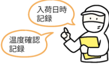
納入業者・食材の品質管理

子どもたちに安全な給食を提供するために、国のガイドラインに沿った衛生管理を行っています。各工程で、決められた内容を実施し、記録しながら作業を行うことで安全性を高めています。